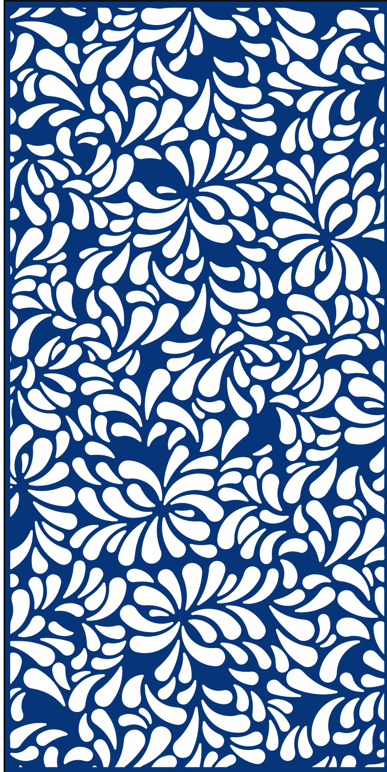
Lapminta 1000 x 2000 mm 1:10 méretarányban